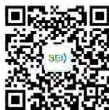
南理工学生事务微平台

南京理工大学本科生管理相关规定详见《南京理工大学学生手册》，手册于开学后发放，学校将组织学习和测试，电子版将于 2023 年 10 月在南京理工大学学生工作处网站 ( http://xgc.njust.edu.cn ) 和官方微信公众号 (i_NUST, 南理工学生事务微平台) 公布，敬请关注！